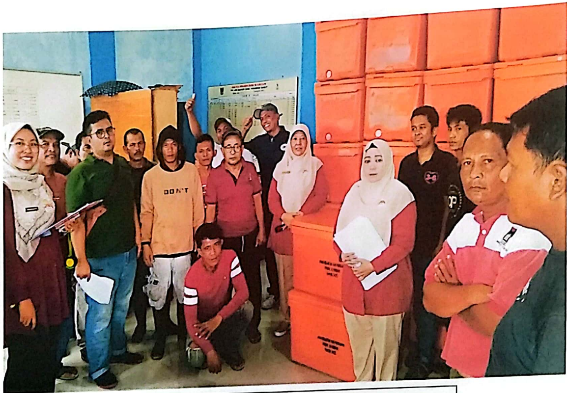
Penyerahan Fishbox di Kabupaten Pasaman Barat