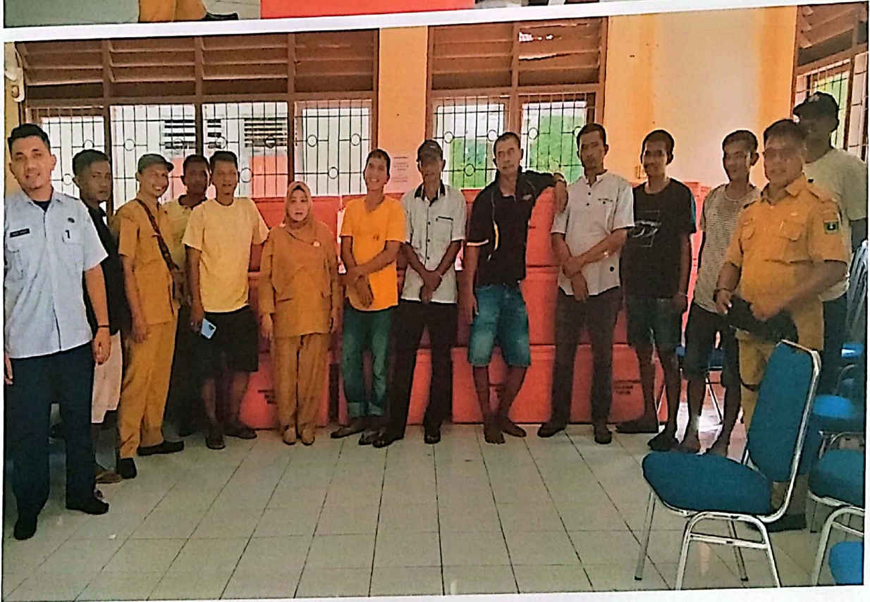
Penyerahan Fishbox di Kabupaten Agam