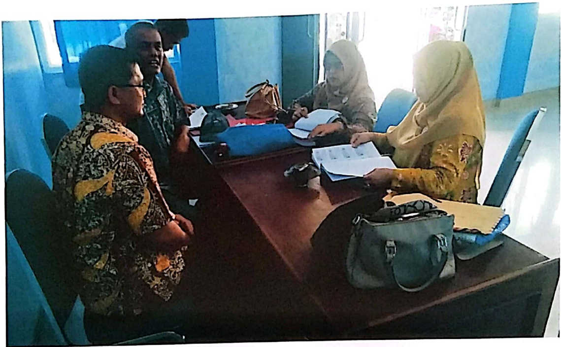
Verifikasi di Kab. Pasaman Barat