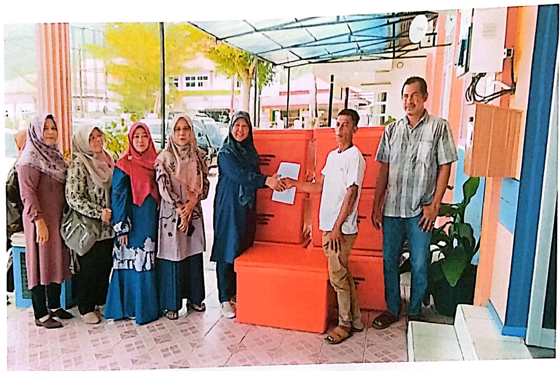
Penyerahan Fishbox di Kabupaten Pesisir Selatan